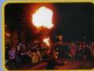
Faites des lumières