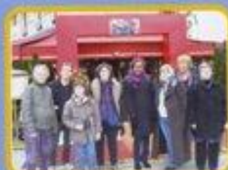
Sortie à Paris avec Mine de rien