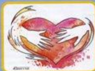
Joyeuse Saint Valentin